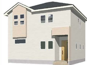
1号棟完成イメージ (現況と異なる場合がございます)

土地面積：172.69㎡ (約52.23坪) 建物面積：109.17㎡ (約33.02坪) 建築確認番号：第R04SHC122614号