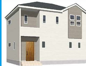
2号棟完成イメージ (現況と異なる場合がございます)

土地面積：140.24㎡ (約42.42坪) 建物面積：101.94㎡ (約30.83坪) 建築確認番号：第R04SHC122615号