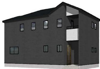
2号棟完成イメージ