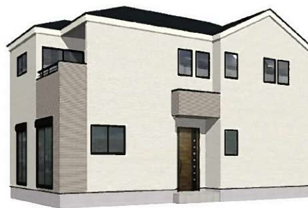
3号棟完成イメージ