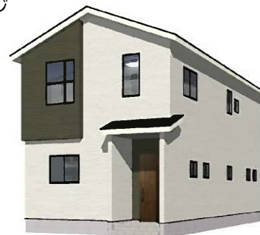
4号棟完成イメージ