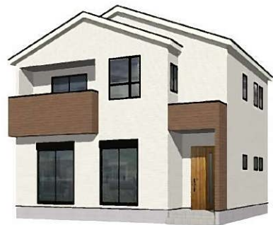
1号棟完成イメージ