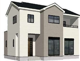
1号棟完成イメージ (現況と異なる場合がございます)

土地面積：154.69㎡ (約46.79坪) 建物面積：107.23㎡ (約32.42坪) 建築確認番号：第R04SHC123500号