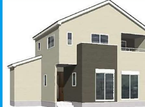
2号棟完成イメージ (現況と異なる場合がございます)

土地面積：202.44㎡ (約61.23坪) 建物面積：105.74㎡ (約31.98坪) 建築確認番号：第R04SHC123501号