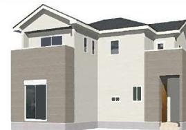
13号棟完成イメージ (現況と異なる場合がございます)

土地面積: 162.27㎡ (約49.08坪) 建物面積: 107.64㎡ (約32.55坪) 建築確認番号: 第R04SHC125673号