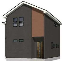
12号棟完成イメージ (現況と異なる場合がございます)

土地面積: 161.63㎡ (約48.89坪) 建物面積: 107.35㎡ (約32.47坪) 建築確認番号: 第R04SHC125672号