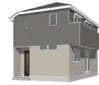
※パースはイメージです。実際の仕上がりとなる場合があります。