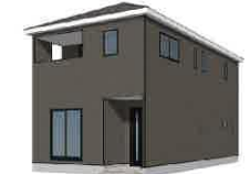
※パースはイメージです。実際の仕上がりとは異なる場合があります。