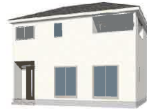
※パースはイメージです。実際の仕上がりとは異なる場合があります。