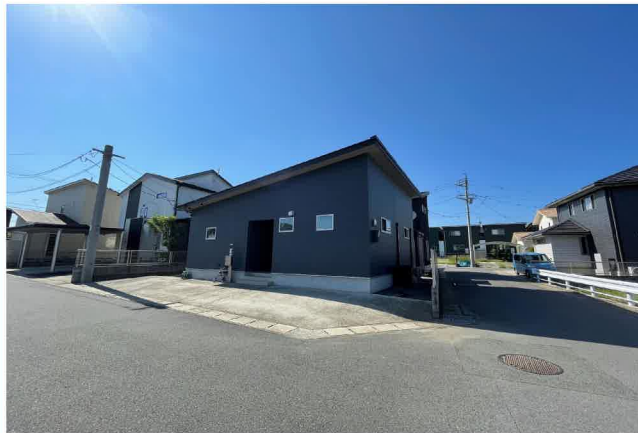
北区楡木3丁目戸建