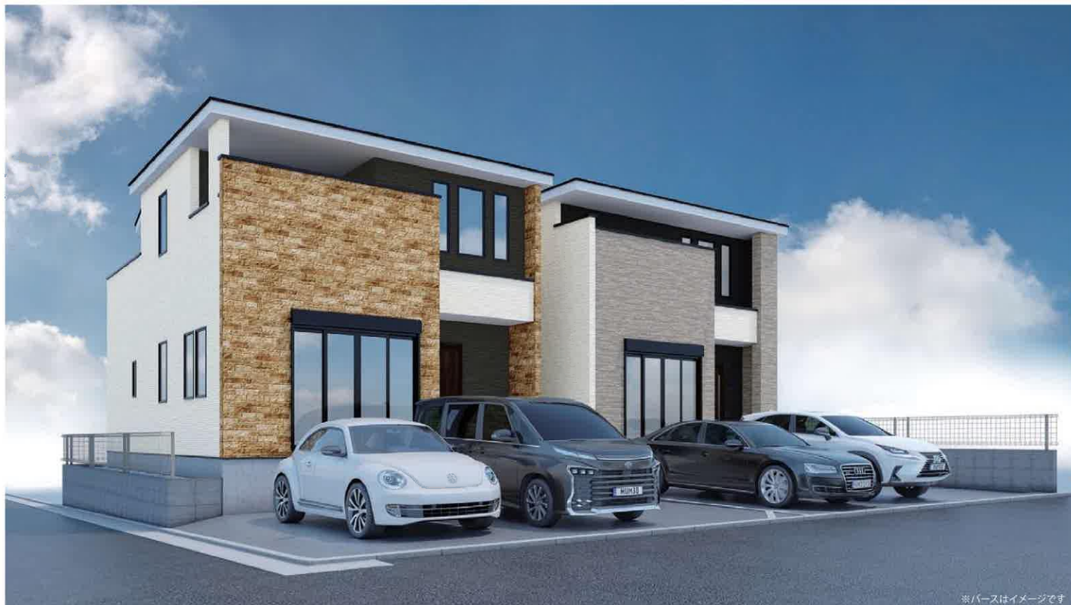
※バスはイメージです