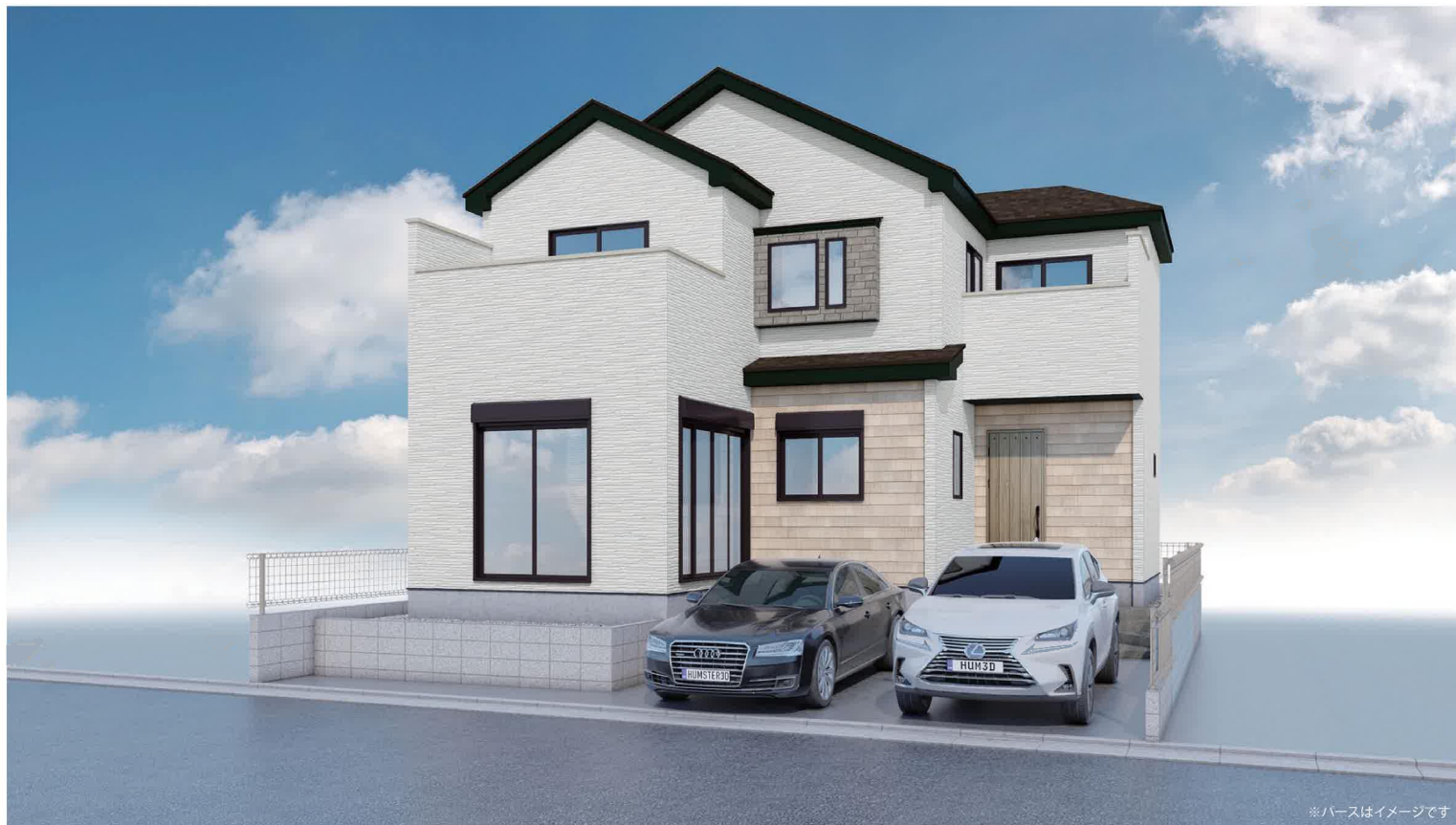
※パースはイメージです