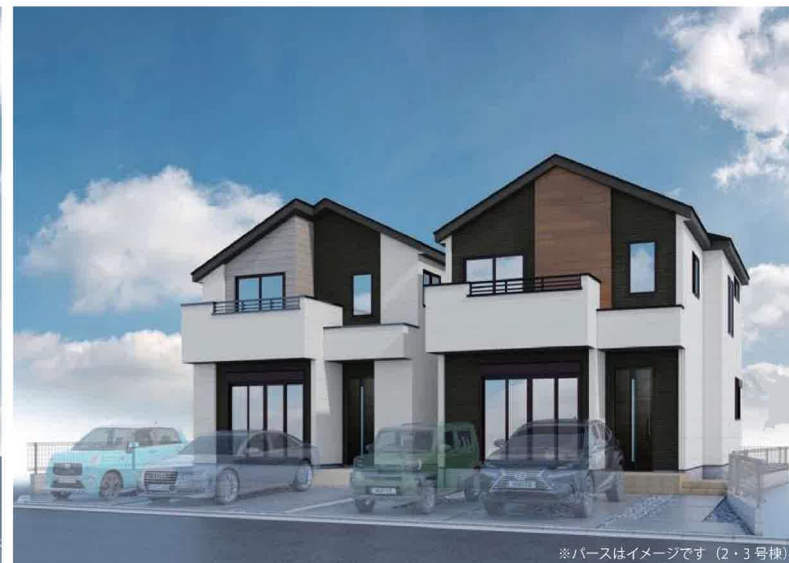
※パースはイメージです (2・3号棟)