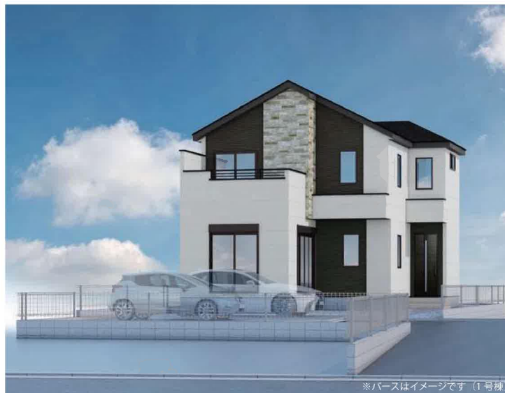
※パースはイメージです (1号棟)