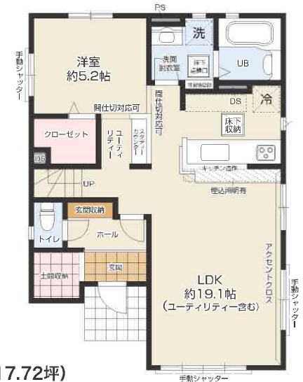
1F / 58.58㎡ (約 17.72坪)