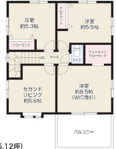
2F / 49.99㎡ (約 15.12坪)