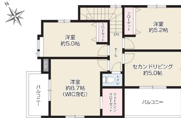
2F / 49.37㎡ (約 14.93坪)