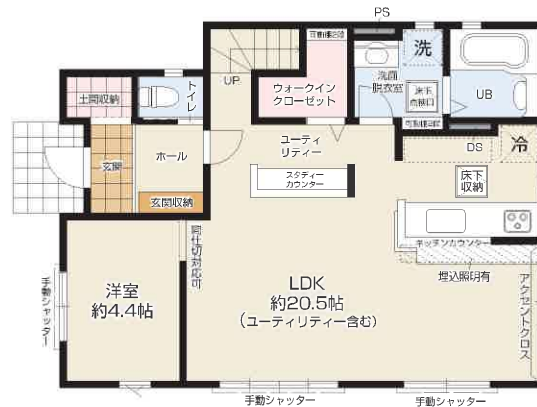
1F / 58.79㎡ (約 17.78坪)