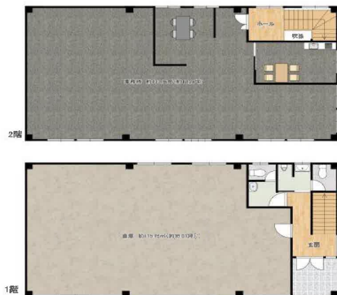
※イメージ間取り図につき視況を優先します