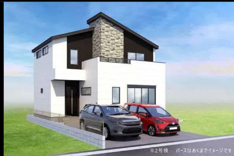
※2号棟 パースはあくまでイメージです