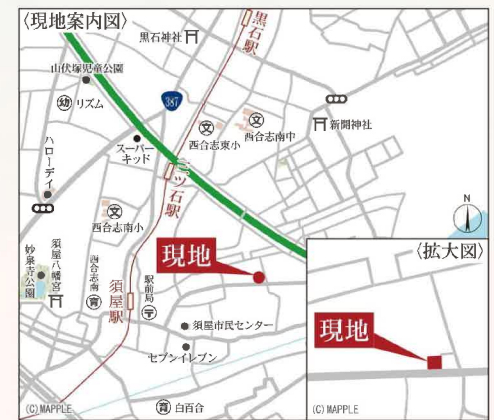
Navi▶熊本県合志市須屋1551番地8

Life information 西合志南小学校.....1,500m(徒歩19分) 西合志南中学校.....1,100m(徒歩14分) スーパーミカエル新店生鮮館.....778m(徒歩10分) セブンイレブン合志須屋市民センター前店.....582m(徒歩8分) スーパーキッド新店.....778m(徒歩10分) 中山会中山記念病院.....1,803m(徒歩23分) 熊本新地郵便局.....1,174m(徒歩15分)